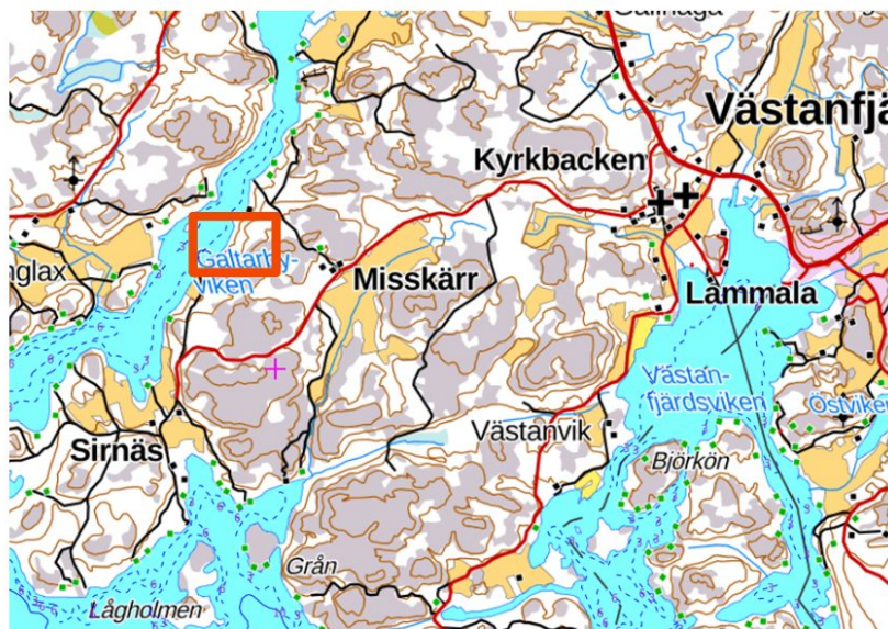
Kuva 1. Sijainti Kemiönsaarella

På området har godkänts strandplan år 1997.