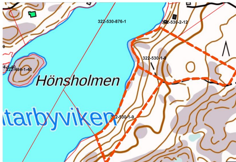
Kuva 2. Karttaote kaava-alueelta