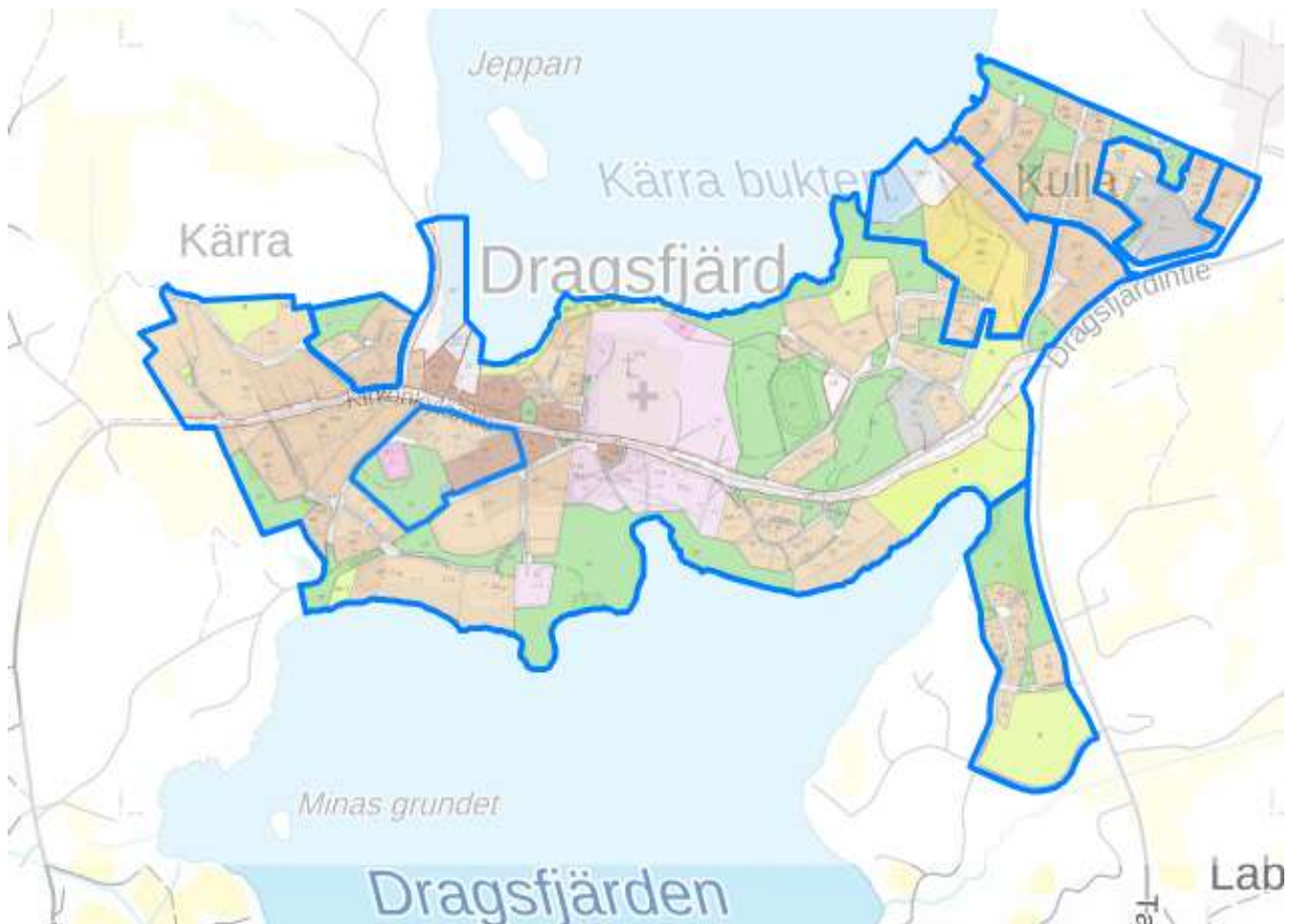
Bild: Utdrag ur tidsenlig detaljplanen av Dragsfjärd kyrkoby

I områdena där detaljplan kommer att utarbetas gäller ingen annan plan än landskapsplanen. På planeringsområdet och i dess omgivning gäller mångsidigt detaljplanebeteckningar som hänför sig till verksamhet i tätortsområden. På området gäller bland annat följande beteckningar: Kvartersområden för boende: kvartersområden för flervåningshus, småhus, radhus och andra kopplade bostadshus samt kvartersområden för bostads-, affärs- och kontorsbyggnader, för byggnader för offentlig närservice, för byggnader för undervisningsverksamhet, för kyrkor och andra församlingsbyggnader, för byggnader för icke-miljöstörande industri samt parker och idrotts- och rekreationsanläggningar.